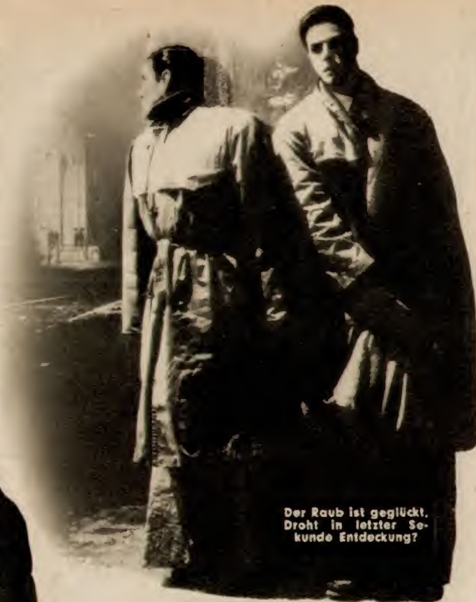
Der Raub ist geglückt. Droht in letzter Sekunde Entdeckung?